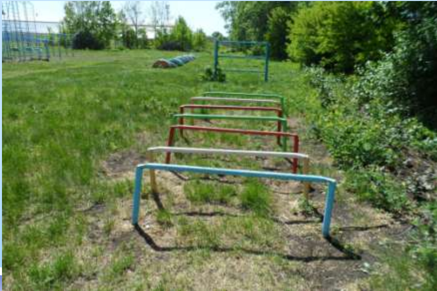
Участок на данный момент